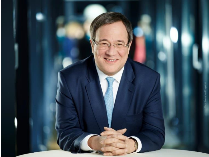
Schirmherr: Armin Laschet, Ministerpräsident des Landes Nordrhein-Westfalen