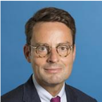
Grußwort: Andreas Bothe Staatssekretär im Ministerium für Kinder, Familie, Flüchtlinge und Integration des Landes Nordrhein-Westfalen