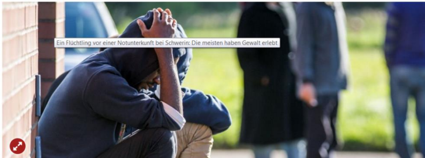
Ein Flüchtling vor einer Notunterkunft bei Schwerin: Die meisten haben Gewalt erlebt

Kinder haben Kriege erlebt, Erwachsene Leichen gesehen: Ein Großteil der Flüchtlinge kommt traumatisiert nach Deutschland. Viele bleiben mit ihrem Leid allein, Psychotherapeuten fordern gesetzliche Änderungen.