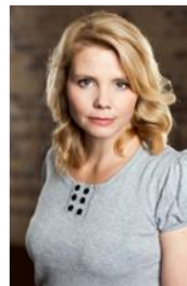
Patin: Annette Frier