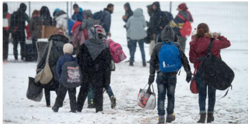
Die Menschen, die heute auf der Flucht sind (hier an der deutsch-österreichischen Grenze), erleben die gleichen Traumata, wie die, die im Zweiten Weltkrieg flüchteten.

Warum tun sich viele Deutsche so schwer damit, Flüchtlinge freundlich zu empfangen auch an unserer eigenen Geschichte, sagt Sabine Bode.